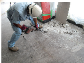
①ピータイルのハツリ (チップー等で)