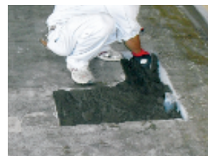
④下地を平滑にするため、 溝やでこぼこがあれば モルタルを塗って調整する。