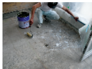
③前日にハイフレックス、 シーラー等の5倍液を ローラーにて塗布。